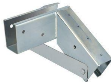
Exempel: Till vänster - båthus med regelvirke och plywood-hörn. Till höger – fast plåtbeslag.