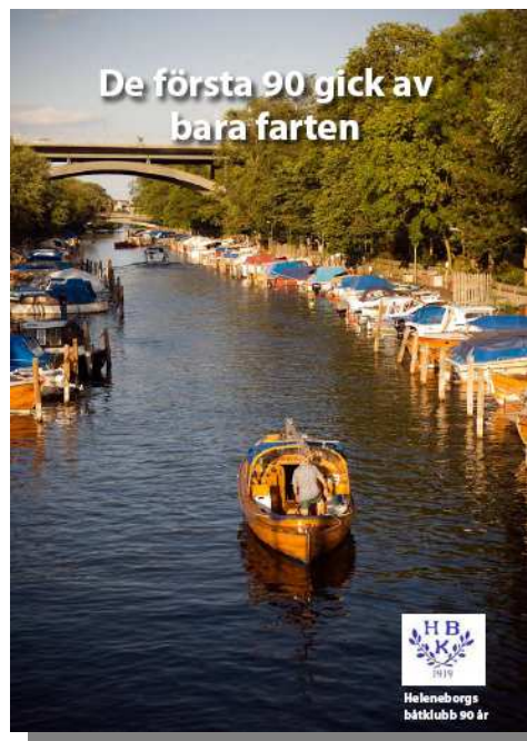
Omslagsbild till jubileumsboken

Vi beställer härmed ____ st. annonsplats/er för införande i Heleneborgs båtklubb 90-års jubileumsbok.