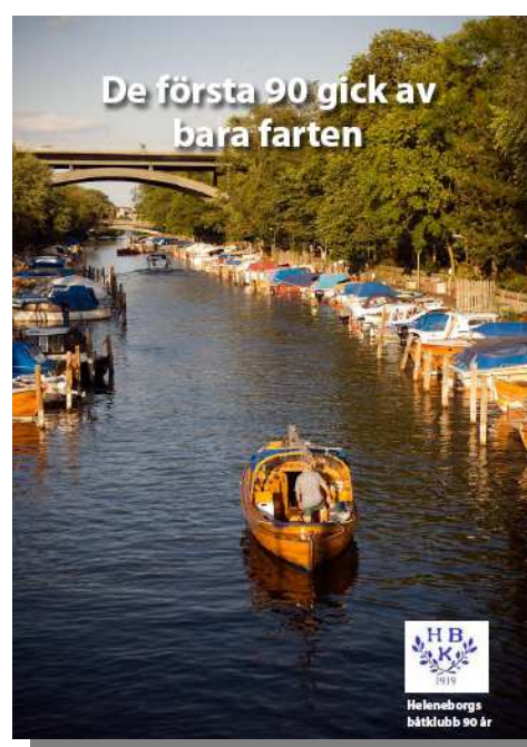
Omslagsbild till jubileumsboken

Vi har tagit del av ovanstående, godkänner och emotser faktura om 5000 skr exkl. moms.