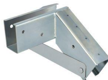
Exempel: Till vänster - båthus med regelvirke och plywood-hörn. Till höger – fast plåtbeslag.